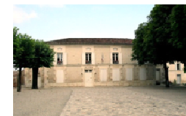
1- Mairie-ancienne école