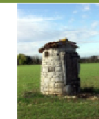
16 - Puits Monplaisir