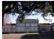
8 - Maison saintongaise -école-