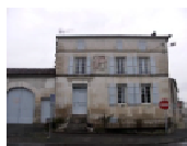
7- Maison inachevée