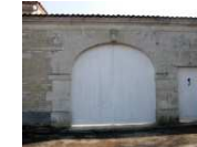
12 - succession de porches