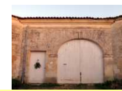
10 - Porche plein cintre