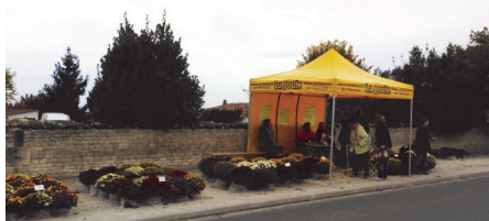
Vente de chrysanthèmes