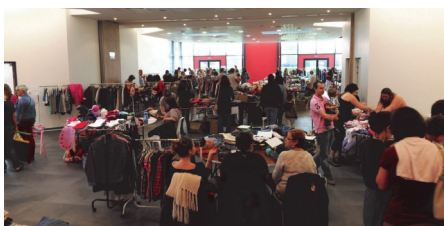
Bourses aux vêtements