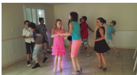
Boum des CM2