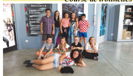
Laser Games CM2