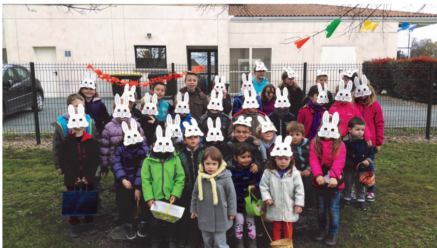
Chasse aux oeufs