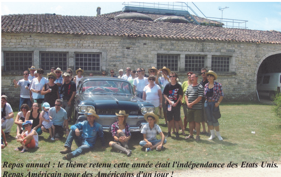
Repas annuel : le thème retenu cette année était l'indépendance des Etats Unis. Repas Américain pour des Américains d'un jour !