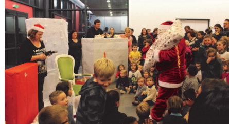
Le Père Noël émerveille les petits...