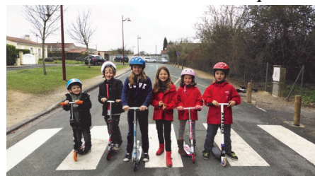
Course de trotinettes