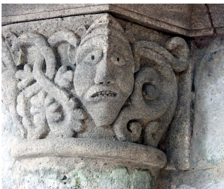
Nouveau chapiteau sur la façade ouest

Après avoir contribué au lancement d'une souscription publique, l'association a présenté un dossier auprès de deux fondations du Crédit Agricole : Agir en Charente-Périgord et Crédit Agricole-Pays de France.