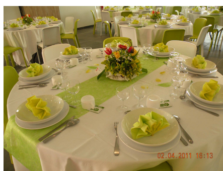
02/04/2011 : Premier repas du Comité dans la salle des fêtes

La mise en service de la salle des fêtes a été pour nous l'occasion de reprendre notre traditionnel dîner dansant, autrefois pour la St Valentin, cette année avec un peu de retard. Nous pensons que la soirée a été appréciée par les personnes présentes aussi bien pour la présentation, la décoration des tables que par le menu et l'ambiance.