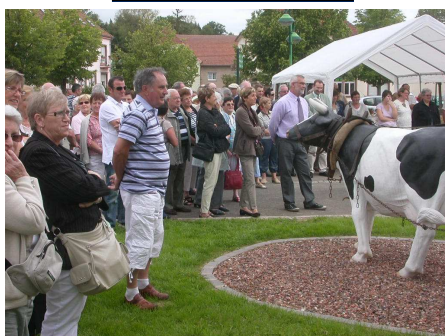
Convivialité et amitié à Volmunster.

2011: Acheminement d'un bus pour participer à la scolarisation d'enfants marocains. Un jeu de maillots de football sera offert à l'équipe locale de Aït-Herzallah.