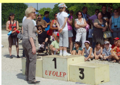
Dernière manifestation en date: LES OLYMPIADES en collaboration avec l'Association des Parents d'Elèves.