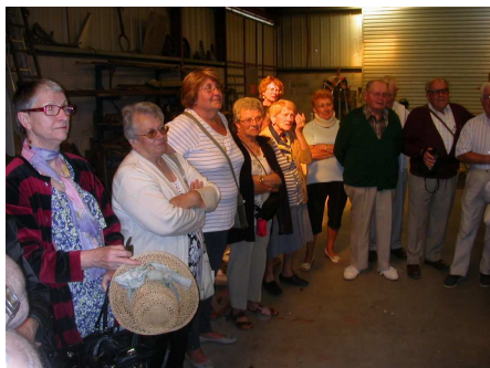
Visite de la coutellerie Renoux à Barret : tous ont été surpris par la qualité du travail artisanal de cette entreprise .

En mai, nous avons visité la coutellerie Renoux à Barret; la journée s'est poursuivie par un copieux déjeuner buffet au restaurant «Les deux Charentes» à Saint-Eugène. L'après-midi fut consacré