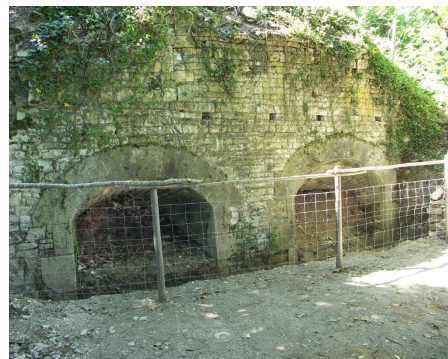
Façade des fours avec les deux ouvreaux