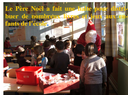
Le Père Noël a fait une halte pour distribuer de nombreux livres et jeux aux enfants de l'école.