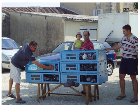
Le club de colombophilie organise un loto le 4 décembre 2011.