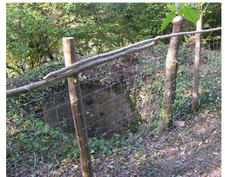
Le haut du four : "le gueulard"

On peut ainsi retrouver les vestiges d'une activité locale oubliée, la conversion du calcaire en chaux par l'action du feu. .